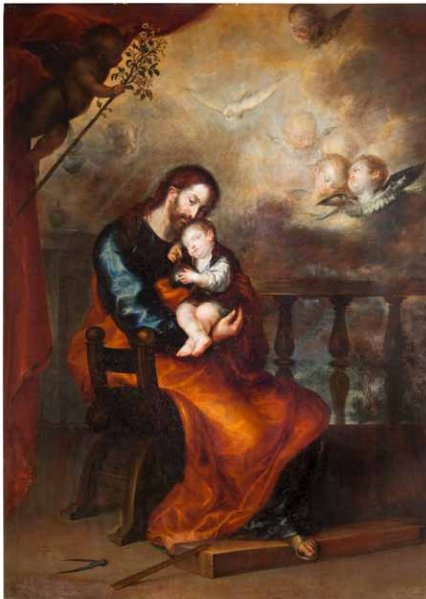
San José con el Niño dormido en brazos. Museo del Prado

En la Carta apostólica en la que declara el "Año de San José", el Papa Francisco nos dice: "Todos pueden encontrar en San José -el hombre que pasa desapercibido, el hombre de la presencia diaria, discreta y oculta- un intercesor, un apoyo y un guía en tiempos de dificultad". De un modo particular, el Pontífice manifestó que quiere destacar el papel de San José como padre que sirvió a su familia con verdaderas humildad y ca-