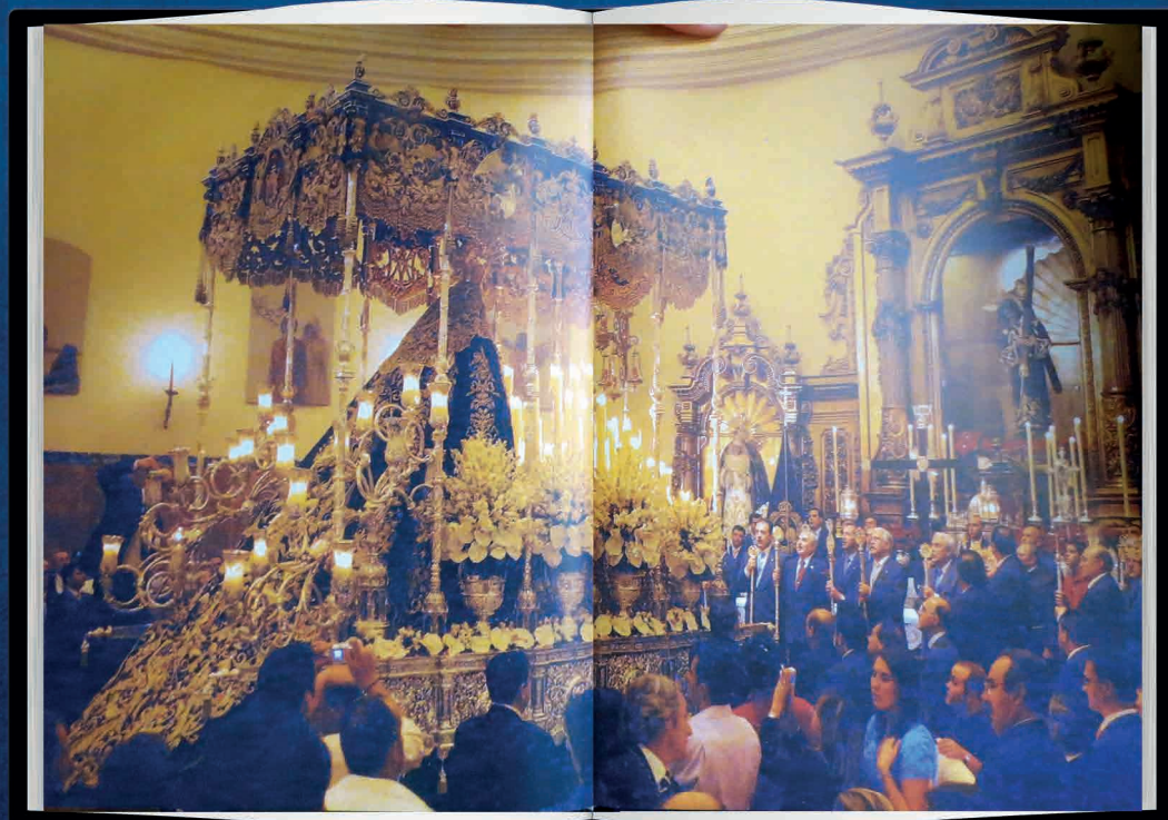
Imágenes del libro “Memoria Histórica de la Hermandad”